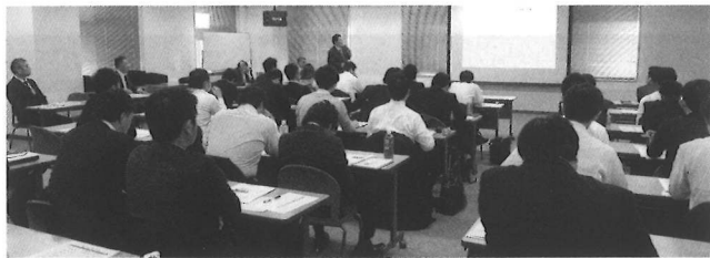
熱心に聴講している様子