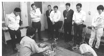
鋼管の切断、切削ねじの加工実演